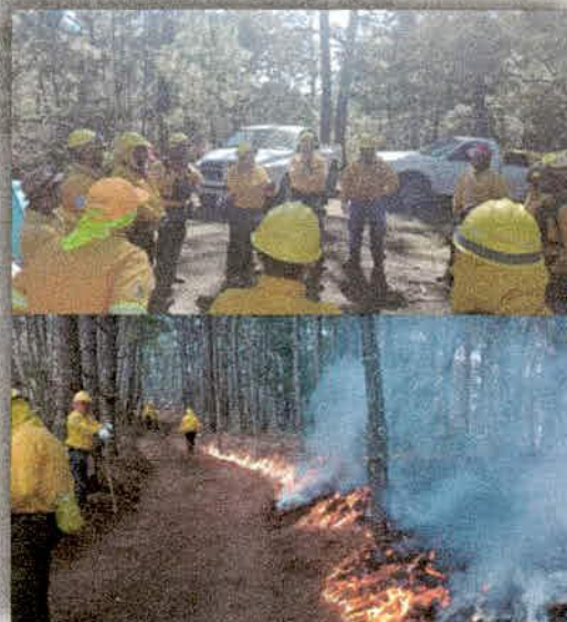
Imagen 11. Ejecución de quema prescrita en el Ejido Ahuacapán misma que estuvo organizada por personal de la CONAFOR y de la DRBSM-CONANP

En el mes de noviembre, en coordinación con la Dirección de la Reserva de la Biosfera Sierra de Manantlan de la Comisión Nacional de Áreas Naturales Protegidas (CONANP) y la Comisión Nacional Forestal (CONAFOR), se llevó a cabo una quema prescrita en el paraje denominado "Los Desmontes" ubicado en el ejido Ahuacapán del municipio de Autlán de Navarro; el objetivo o prescripción de la quema fue reducir en un 80% el combustible disponible en cerca de 20 hectáreas,