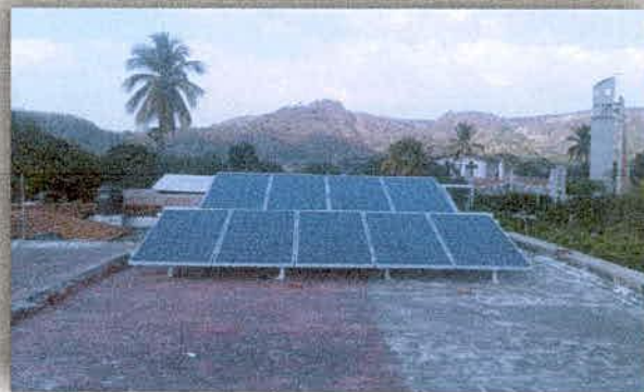
Imagen 16. Instalación de paneles en el ayuntamiento de Tuxcacuesco.