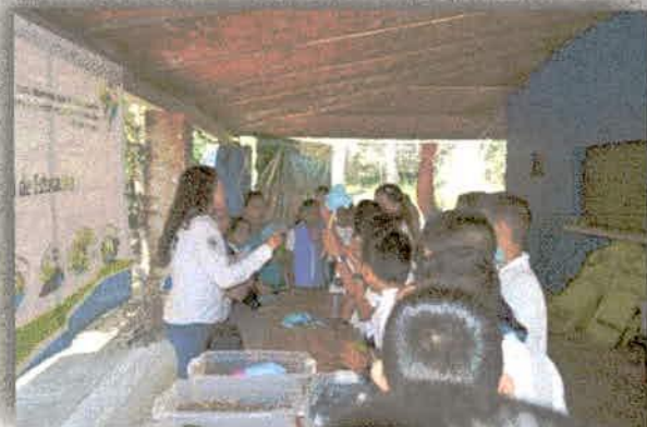
Imagen 6. Alumnos de primaria en el juego ¿Qué tanto sabes?, en el municipio de El Limón, Jalisco.

• 15 marzo, Eco-Talleres en la Esc. Secundaria Técnica # 38 de Zapotitlán de Vadillo, para celebrar el 40 Aniversario de la Escuela y el Día Mundial del Agua.