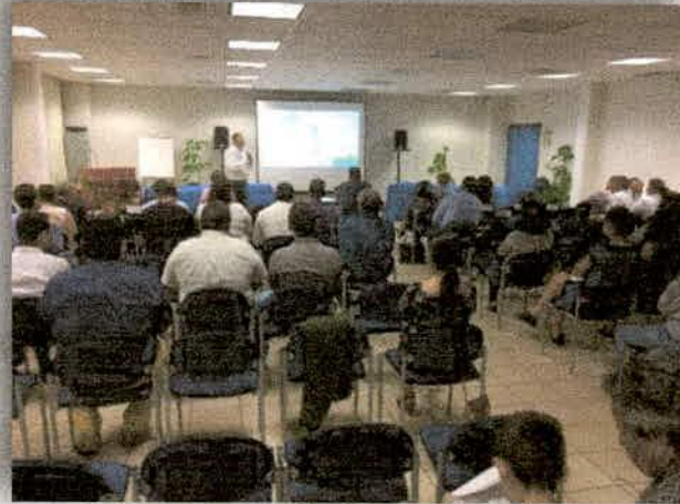
Imagen 24. Celebración del X Aniversario de la JIRA, CUCSUR UdeG, Autlán Jalisco.

El 27 de Octubre se llevó a cabo el evento del "X Aniversario de la JIRA" en el Centro Universitario de la Costa Sur, en donde se presentó desde cómo surgió la JIRA, las diferentes perspectivas desde el Gobierno Estatal, Municipal así como los retos y alcances (logros) que se han tenido por la gestión y trabajo en conjunto entre Gobierno, Equipo Técnico, Asociaciones, Dependencias y la sociedad.