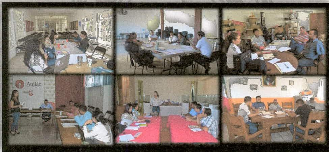
Imagen 5. Mesas de trabajo para la elaboración de Planes Municipales de Educación Ambiental para la Sustentabilidad, Bajo Condiciones de Cambio Climático.

Cabe destacar que, dentro del proceso de planificación para la elaboración de los PMEAs, participaron las diferentes áreas del ayuntamiento como Agua Potable, Ecología, Fomento Agropecuario, Turismo, Obras Públicas, Protección Civil y Desarrollo Humano y Social, ya que este trabajo no corresponde solamente al área de ecología, motivo por el que se consideró promover la vinculación en estas áreas para realizar una planificación a largo plazo y potenciar los resultados.