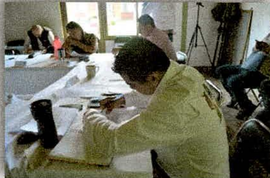
Imagen 21. Evaluación del CA-JIRA al director de la JIRA.

Se realizó una evaluación el personal por parte de la dirección técnica y los consejeros que integran el consejo de administración de la JIRA, esto como parte de los acuerdos fomentados en sesión plenaria de este consejo; los resultados fueron positivos para