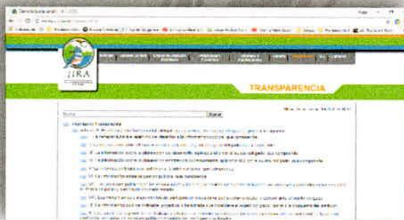
Imagen 22. Apartado de Transparencia de la página oficial de la JIRA.

Se actualiza la información en la página de transparencia de la JIRA, así como en la Plataforma Nacional de Transparencia. El 5% restante se refiere a información que, aún no se tiene completa y se tendrá a inicios del 2018.