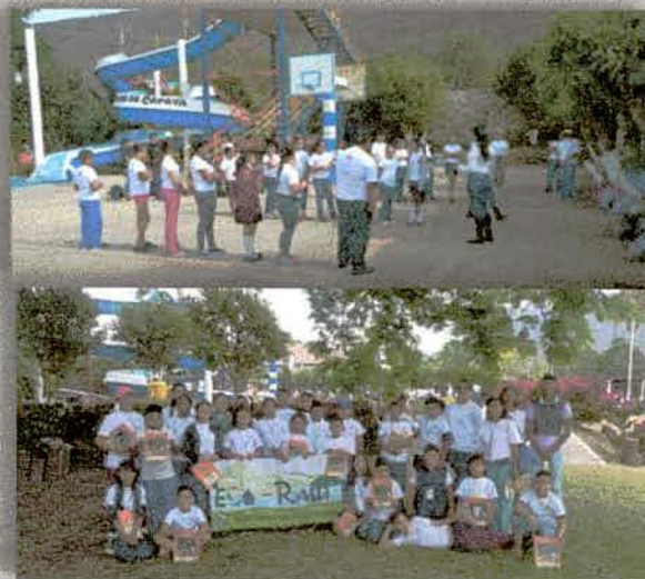
Imagen 8. Encuentro Infantil "Haciendo un México Posible", iniciativa realizada por parte de la DRSE, en el municipio de Autlán, Jalisco.

• 28 y 29 de abril, de la DRSE participó en el Encuentro Infantil "Haciendo un México Posible"