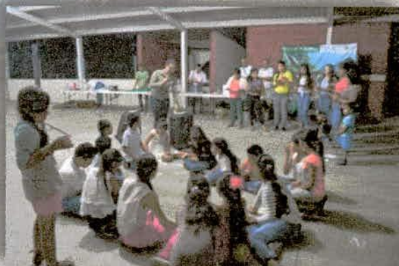
Imagen 9. Juego de lotería Forestal en el evento del Festival del Jaguar, organizado por la DRBSM en el municipio de Tuxcacuesco, Jalisco.

• 7 eventos en los municipios de Autlán, El Limón, Tonaya, Tuxcacuesco, Tolimán, San Gabriel y Zapotitlán de Vadillo, como parte del X Aniversario de la JIRA (evento regional).