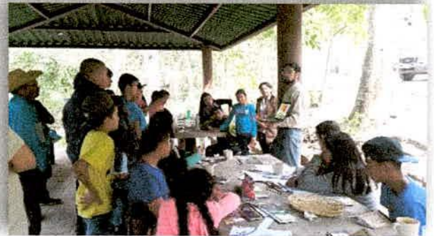
Imagen 1 . Capacitación a Grupos de monitoreo en la JIRA. Lugar "la taza" municipio de Tolimán, Jalisco.

En esta primera etapa se logró la consolidación de grupos, y en una segunda etapa en el año siguiente, se espera establecer una plataforma de información para que sea pública y de fácil acceso para la población en general.