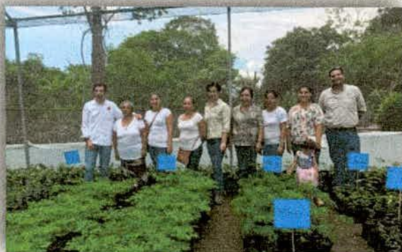
Imagen 14. Visita de los secretarios SEDIS y SEMADET a proyecto invernadero para la producción de plantas nativas, forrajeras, maderable y frutales de San José del Carmen, Mpio. De Zapotitlán de Vadillo.

Se firmó un convenio entre la Secretaría de Desarrollo e Integración social (SEDIS), Secretaría de Medio Ambiente y Desarrollo Territorial (SEMADET) y la Junta Intermunicipal Río Ayuquila (JIRA), se ejercieron $ 675,000.00 pesos, en donde se apoyó a proyectos con Mujeres y Jóvenes. Se dio acompañamiento a los tres grupos organizados en las localidades de: Ventanas en el Mpio. de Tuxcacuesco con producción de café de mojote; Tetapán Mpio. de Zapotitlán de Vadillo producción de Pitahaya; Huisichi, Mpio de Tolimán producción de pitayo. Se acompañó desde la realización de cotizaciones,