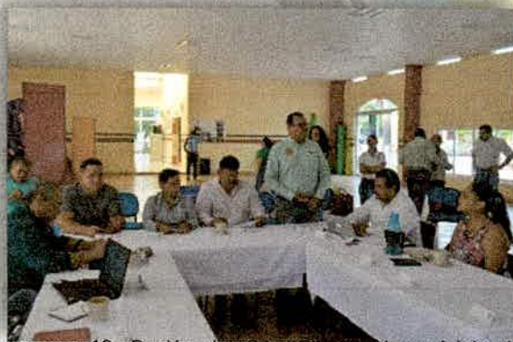
Imagen 19. Sesión del CA-JIRA en el municipio de Tuxcacuesco, Jalisco; toma de protesta del presidente municipal de San Gabriel, como presidente del Consejo de Administración.

Por acuerdo del Consejo de Administración, se agendaron siete sesiones, de las cuales se realizaron seis, lo anterior por cuestiones de logística y agenda con los ayuntamientos.