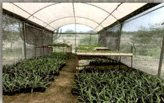
Imagen 13. Invernadero para producción de plantas de mezcal por semilla.

Acompañamiento y seguimiento a los 10 productores que han sido apoyados en años anteriores, con la finalidad de brindar apoyo técnico durante el proceso de establecimiento de los sistemas productivos. Se incorporó un extensionista, fortaleciendo el trabajo haciendo énfasis en capacitaciones para establecer actividades puntuales en las parcelas, además de haberse elaborado un programa de trabajo a corto y mediano plazo, en donde se contempla preparar a productores para incluirlos en el programa de concurrencia 2018, así como vincularlos con los viveros regionales para la compra de la planta de la región. Se realizaron gestiones con el CATIE y la SEDER, para el establecimiento de escuelas de campo regionales lo que permitirá que todos los municipios puedan tener acceso a capacitación.