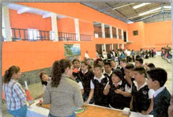
Imagen 10. Intervención de Educación Ambiental en el evento en conmemoración del X aniversario de la JIRA en el municipio de Zapotitlán de Vadillo, Jalisco.