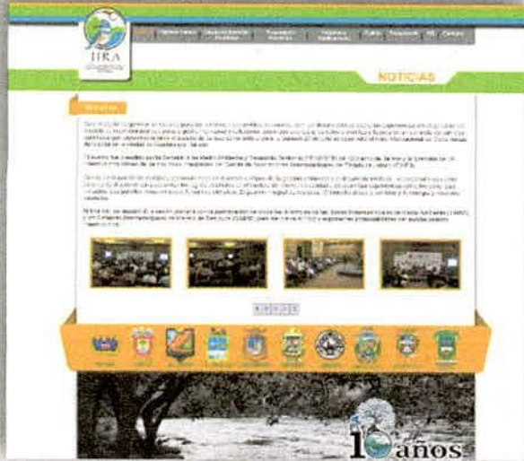
Imagen 23 . Apartado de Transparencia de la página oficial de la JIRA.