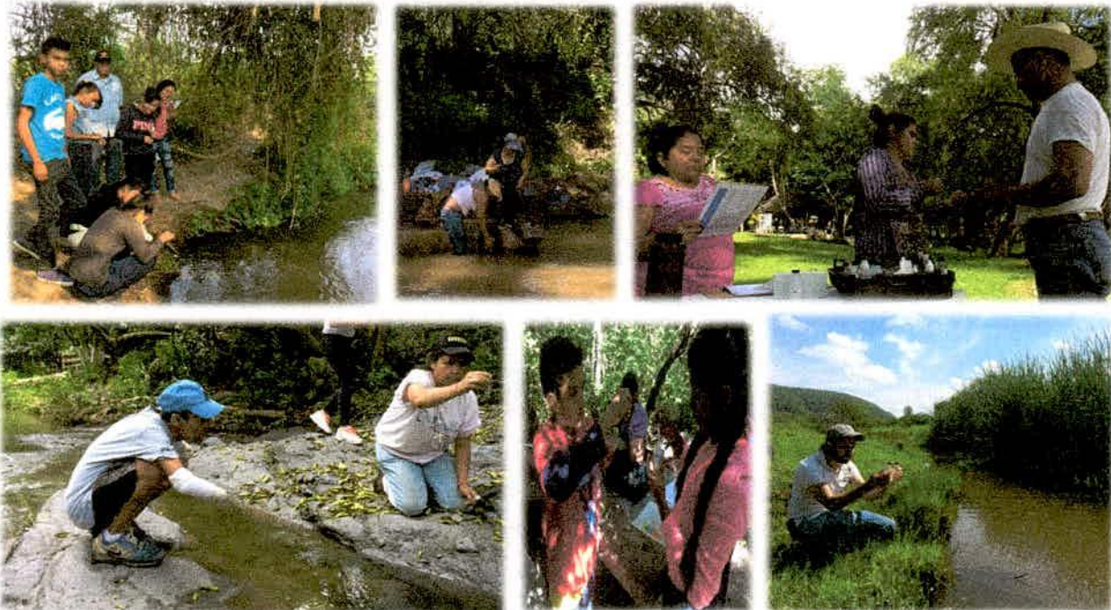
Imagen 2. Monitoreo de calidad de agua.