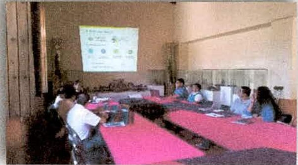
Imagen 17. Consulta Pública de los PACMUN en Tonaya, Jalisco.

La JIRA cuenta con el proceso de la consulta pública de los Planes de Acción Climática Municipal (PACMUN). Gracias al avance en éste aspecto, se ha dado el paso siguiente en algunos municipios al aprobar los PACMUN ante cabildos, no obstante, el año siguiente se podría dar por concluido en los demás municipios, y seguir trabajando con acciones de adaptación y de mitigación ante el cambio climático; además de ser un insumo importante para la gestión de recursos.