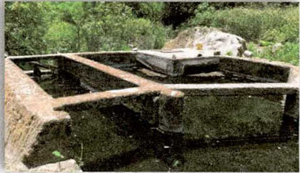
Imagen 3. Sistema de abastecimiento de agua potable, municipio de Tolimán.

La JIRA se coordinó con las diferentes dependencias involucradas de alguna manera con el manejo y uso del agua derivada del Acuífero Autlán-El Grullo. Resaltó en 2017 el trabajo que se ha mantenido a través de los años por la coordinación con la Gerencia Operativa de la Comisión de Cuenca del Río Ayuquila-Armería. Se compartió y revisó información de la Comisión estatal del Agua (CONAGUA), se elaboró un informe sobre la situación del acuífero Autlán-El Grullo, el cual se estima que presenta un desabasto de 0.8% en su recarga; esta situación marca una pauta muy importante respecto a las necesidades que se tienen en la región de la JIRA, por lo que se trató el tema con la CONAGUA y actores clave, acordando que se realizará un monitoreo piezométrico, para evaluar la fluctuación en el nivel del acuífero y generar información para toma de decisiones en el uso del agua en los municipios que lo integran.