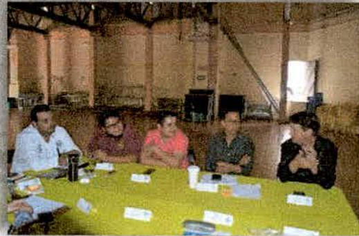
Imagen 20. Sesión del CA-JIRA en el municipio de El Limón, Jalisco, en la presentación y aprobación del POA 2018.

Se tiene aprobado el POA 2018, esto con base en el acuerdo CA-JIRA 005/14-12-17, fomentado en la VI sesión ordinaria realizada el 14 de diciembre de 2017 en la cabecera municipal de El Limón, Jalisco.