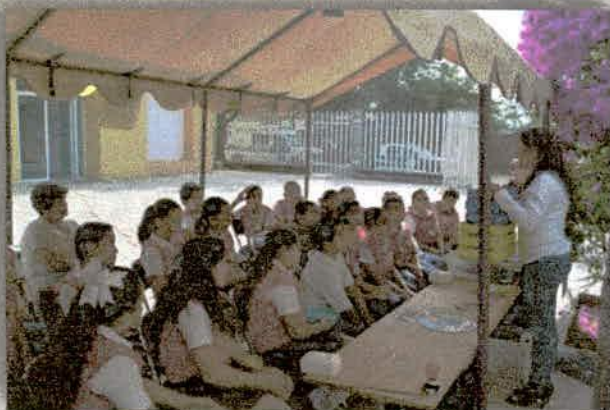
Imagen 7. Evento en el Tiopa Tlanextli, A.C., alumnos de la primaria Narciso Mendoza, en el municipio de Autlán, Jalisco.

• 25 de abril Por invitación del Tiopa Tlanextli, A.C. participó en la Onceava Semana Médico Infantil "Te reto a aprender."