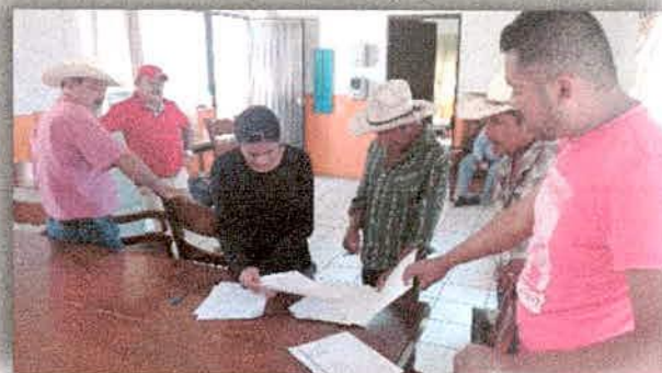
Imagen 12. Firma de notificaciones de apoyos de concurrencia para proyectos Silvopastoriles.

Seguimiento a los 11 proyectos para la implementación de sistemas Silvopastoriles en las localidades de El Chante, del Mpio. de Autlán (2 proyectos); Zenzontla Mpio. de Tuxcacuesco (1 proyecto); Tonaya (1 proyecto); San Buena Aventura Mpio. del Limón (1 proyecto); El Rodeo, Copala, Playitas Mpio. de Tolimán (5 proyectos); San José del Carmen Mpio. de Zapotitlán de Vadillo (1 proyecto).