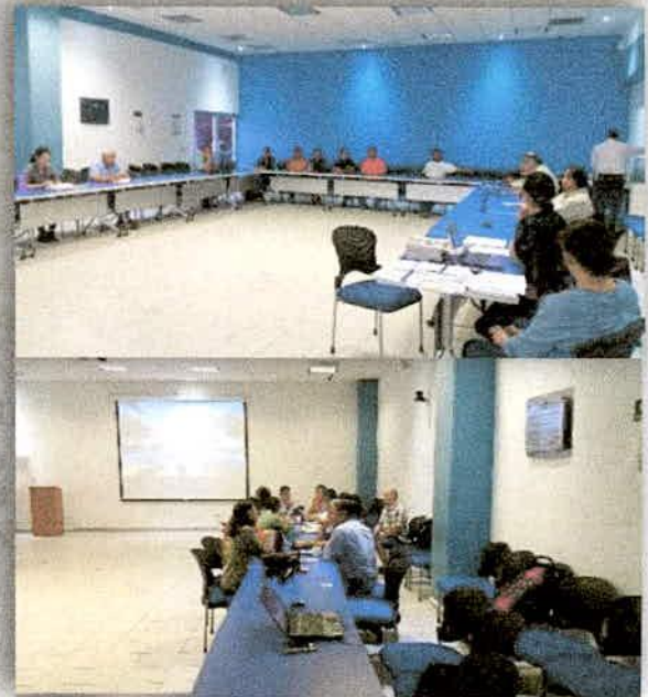
Imagen 18. Consulta Pública de los PACMUN en Autlán, Jalisco.